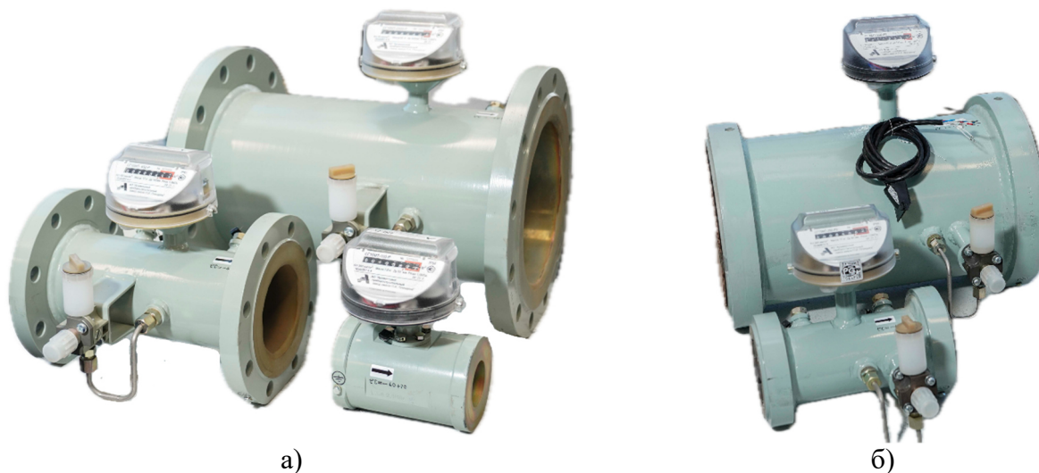
Рисунок 1 – Общий вид счетчиков а) общий вид счетчиков исполнения СГ16; б) общий вид счетчиков исполнения СГ75

с нанесением знака поверки давлением на пломбы на винт крепления крышки счетного механизма. Заводской номер в виде цифрового кода наносится на лицевую панель счетной головки методом лазерной гравировки. Место нанесения заводского номера и знака утверждения типа представлены на рисунке 2. Схема пломбировки от несанкционированного доступа и место нанесения знака поверки представлены на рисунке 3.